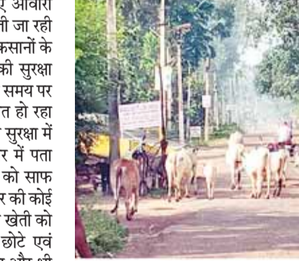
खर्च हो चुके हैं। इसके बाद भी जो गौशालाएं ग्राम पंचायत क्षेत्र में स्वीकृत हुईं वह आज तक पूर्ण नहीं हो पाई वर्ष 19-20 में जिन गौशालाओं की स्वीकृत हुईं। उनमें कई गौशालाओं का ही संचालन हो रहा है। एवं शासन द्वारा राशि भी आवंटित हो रही है लेकिन कितने मवेशी वहां है, गौशालाओं की क्या स्थिति है। यह समझ से परे है। वहीं वर्ष 2020 और 21 में सैकड़ों गौशालाओं की स्वीकृत हुईं जहां अभी तक कुछ ही गौशालाओं का ही संचालन हो रहा है। जबकि अधिकांश गौशालाओं को पिछले 4 सालों से निर्माणाधीन बताया जा रहा है। पता नहीं निर्माणाधीन गौशालाओं को पूर्ण करने में अभी और कितने साल बीत जाएंगे सवाल तो यह भी है। कि जहां गौशालाओं का निर्माण हुआ है। और संचालन हो रहा है। वहां भी आवारा मवेशियों की समस्या यथावत है। ग्रामीण क्षेत्रों की गौशालाओं में मवेशियों को

मऊजंज। जिले में खेती के लिए आवारा मवेशियों की समस्या गंभीर रूप लेती जा रही है। वर्तमान समय पर खेती कर रहे किसानों के सामने आवारा मवेशियों से खेतों की सुरक्षा करना मुश्किल हो रहा है। महंगाई के समय पर जहां खेती करना महंगा सौदा साबित हो रहा है। वही बोनी के बाद जिन खेतों की सुरक्षा में थोड़ी भी चूक होती है। तो रात भर में पटा चलता है कि आवारा मवेशी खेतों को साफ कर देते हैं। किंतु इस मामले में सरकार की कोई ऐसी योजना नहीं है। जिससे किसान खेती को सुरक्षित कर सके खास तौर पर छोटे एवं मध्यम किसानों के लिए यह समस्या और भी चुनौती पूर्ण साबित हो रही है।